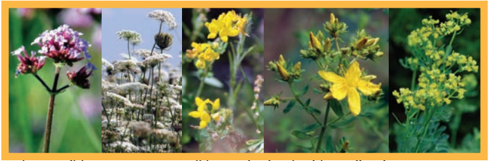
verbena, wilde peen, gewone rolklaver, sint-janskruid en wijnruit

De basis van de Vlindertuin wordt gevormd door inheemse planten die voedsel leveren aan zowel rupsen, zgn. waardplanten, als aan vlinders, zgn. nectarplanten. Met een lange roltong halen vlinders de nectar uit de bloemen. Populaire nectarplanten in de zomer zijn: vlinderstruik, leverkruid, wilde marjolein, braam, liguster, boerenwormkruid, distel, sint-janskruid en gewone brunel . Planten die in de zomer vooral als waardplant gebruikt worden zijn: brandnetel, klaver, koolsoorten, engelwortel, venkel, wijnruit, verbena en verschillende grassoorten . Daarnaast gebruiken vlinders bomen en planten ook als herkenningspunten. Hoog uitstekende planten en bomen worden bovendien door mannelijke vlinders gebruikt als uitkijkpost om vrouwtjes te zoeken en hun territorium te verdedigen.